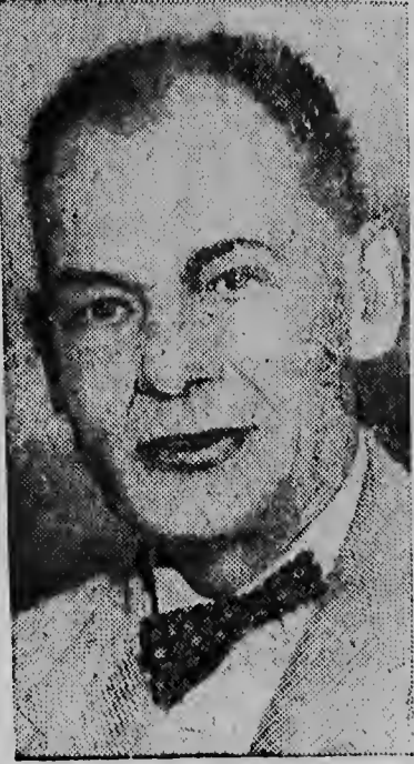
A TEAM of three American scientists, headed by Dr. John F. Ender (above), 57, of Harvard University, won the 1954 Nobel Prize in medicine and physiology for their achievement in the fight against polio. The other two scientists who will share the $35,000 prize are: Dr. Thomas H. Weller, 39 also of Harvard, and Dr. Frederick C. Robbins, 38, of Western Reserve Medical School, Cleveland.